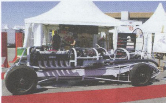
Karosserie: Auf diesem Bild ist der Rahmen und die Anordnung des Motors zu sehen. Beim Rangieren braucht es sehr viel Kraft.