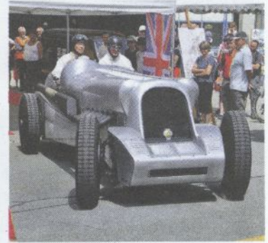
Markant: Die Piloten wirken hinter der wichtigen Front wie Spielzeug-Figuren.

Die Piste bebzt am Samstag, 8. Oktober 2011 auf dem Rundkurs des autobau in Romanshorn. Punkt 14 Uhr kommen die zwölf Zylinder des wuchtigen Boliden Rolls-Royce Hurricane in Bewegung. Und wer Motoren sound satt mag, sollte diesen exklusiven Event in der Ostschweiz auf keinen Fall verpassen.