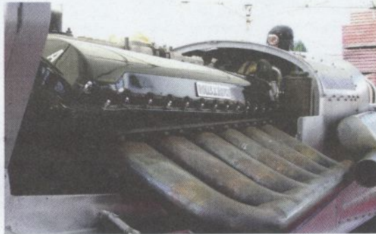
Wichtig: Der Motor wurde auch von der britischen Luftwaffe im Zweiten Weltkrieg eingesetzt. Der Bolide wiegt fast drei Tonnen.